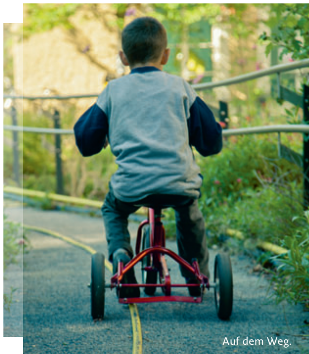
Auf dem Weg.